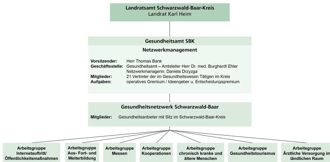
Abbildung 3: Organigramm Gesundheitsnetzwerk Schwarzwald-Baar, eigene Darstellung